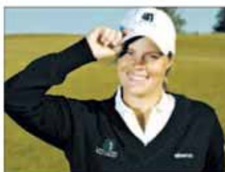
Johanne Skovgaard, medlem af det danske hold til Ryder Cup 2008.